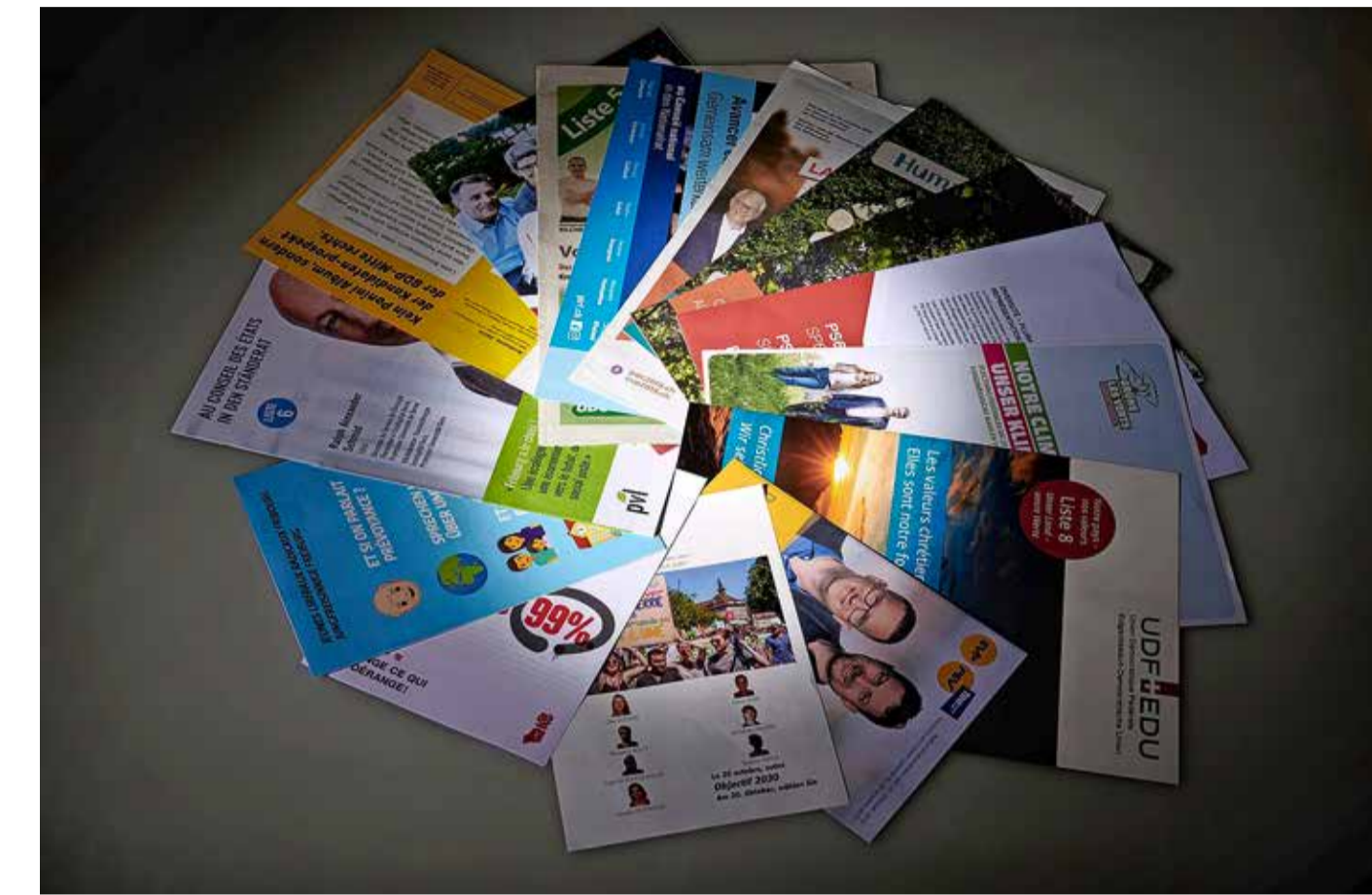
Das Institut Delahaut befragte Freiburgerinnen und Freiburger im Hinblick auf die eidgenössischen Wahlen.